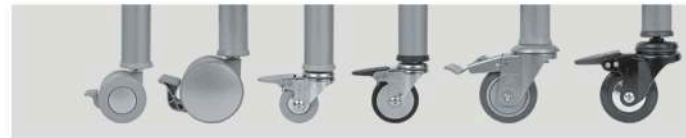
Carga Máx.: R6,5F 20 kg, R9F 30 kg, *R7F 40 kg, *R8,5F 45 kg, *R10F 55 kg, *R10,5F 60 kg

Uma seleção de 2 modelos em plástico black ou silver com freio e 4 profissionais em aço e roda PVC com freio, nas cores black, silver ou chrome.