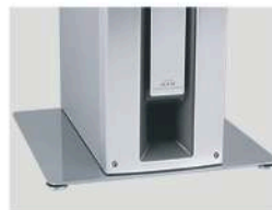
Base para Subwoofer Mod. Base sub 50

Base com spikes para uso em prateleiras nas cores black ou silver.